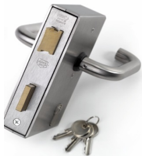
Locks for doors and gates