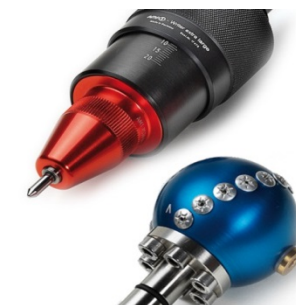
Marking and Cleaning