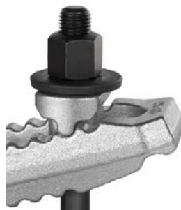
mechanical clamping elements