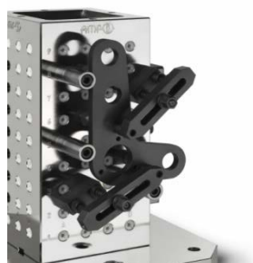
Modular fixturing systems